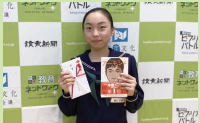
第5回全国中学生ビブリオバトル 優秀賞 (令和4年3月、東京都で開催)