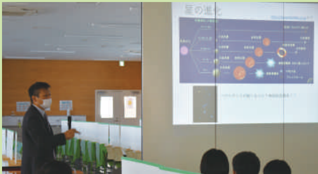
国立天文台の先生による天文学の授業

開成や灘など、県外の中高一貫教育校や研究機関の先生を特別講師として招いて、高校での内容を学び、好奇心を高めます。