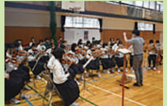
吹奏楽部と弦楽部による演奏 (壮行会)