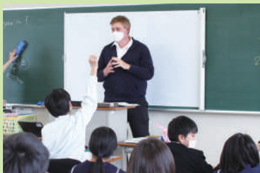
外国人講師によるオールイングリッシュの授業