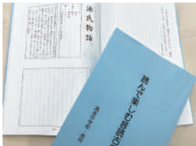
◀高志中学校・高校が独自で作成した古典教材

授業の始めの10分間、日本や中国の代表的な古典作品を音読し、概要に触れることにより、古典文法や文学史、古典常識など高校での学習へとスムーズにつながるようになります。また中学3年次には学校設定教科「論文基礎」を学習し、探究学習の成果を8,000字の卒業論文にまとめます。