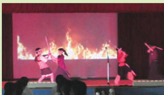
中学生の自作自演によるミュージカル(学校祭)