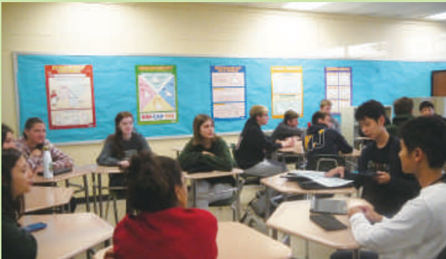
アメリカのニュープロビデンス高校でのプレゼンテーション (令和元年度に実施した海外研修の様子)

「飽くなき探究心と課題解決能力を備え、福井から世界をリードする科学技術関係人材の育成」を目指し、大学・企業・研究機関等と連携した授業、北米やアジア等の国々で行う海外研修等を行っています。