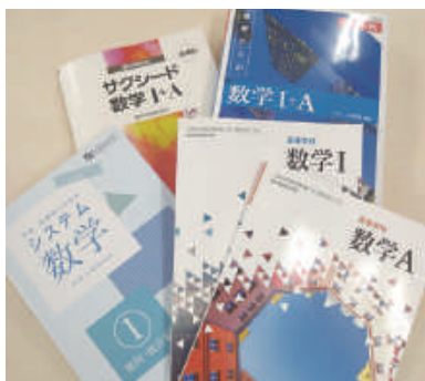
◀先取り学習で使用する数学の教科書や問題集

中高一貫校用テキストを使用することにより、効率的に学習を進めます。中学3年次には、高校で学習する数学の先取り学習を行います。