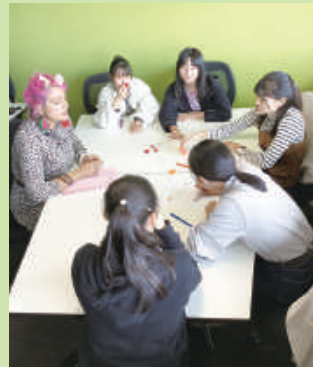
オーストラリアのスインバン大学での英語研修 ホームステイ先家族との対面 (令和元年度に実施した海外研修の様子)

「グローバルな視野で新しい分野に挑戦し、地域社会にイノベーションを起こす人材の育成」を目指し、大学・企業等と連携した授業、アジアやオーストラリアでの海外研修等を行っています。