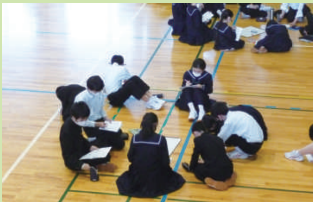
新入生を迎える交流会（令和4年4月）