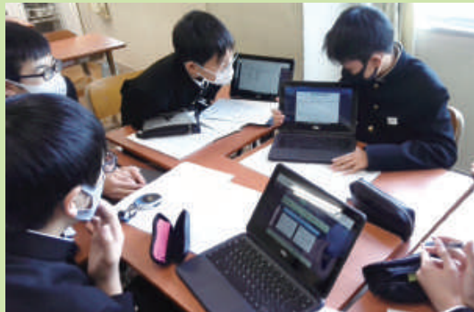
一人1台のタブレットを使った授業

※毎週木曜日は清掃がありません。代わりに中高生の交流イベントや生徒会の話し合いなどが行われることがあります。