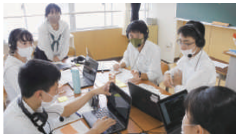
第11回全国中学生英語ディベート大会 7位