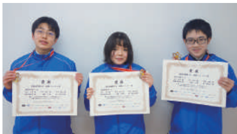
令和3年度科学の甲子園ジュニア全国大会 情報1位、数学1位、総合7位