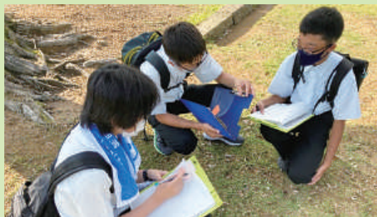
夏期課外講座(社会A 古今「福井」～古地図をもとに散策し、昔と今の福井を眺めてみよう!～)