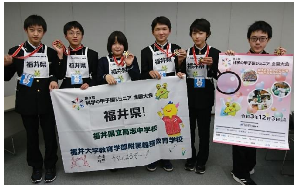
全国大会に出場した福井県代表チーム