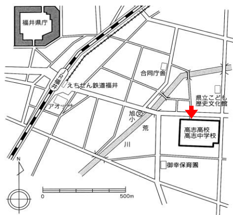
学校周辺図 （上方向が北）