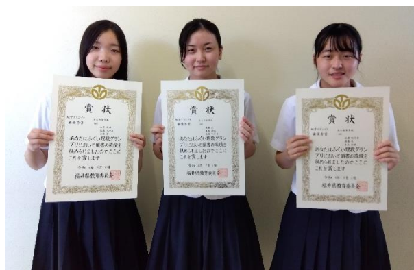
地学部門 最優秀賞