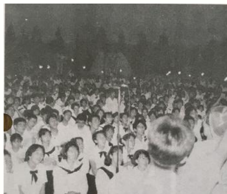
フィナーレは全員合唱 『高志高校新聞』148号（平成2年10月） 高志高等学校新聞部 1990より